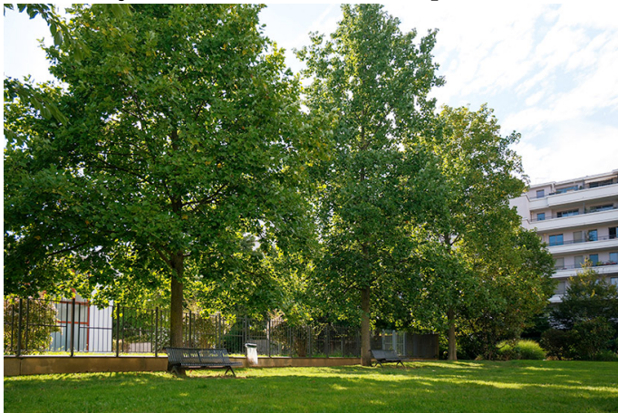
Tulipiers de Virginie.