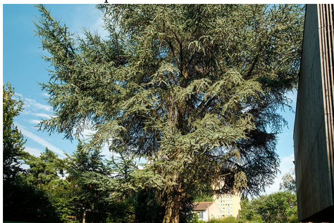
Métaséquoia du Sechuan.