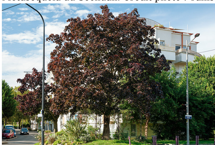
Hêtre pourpre.