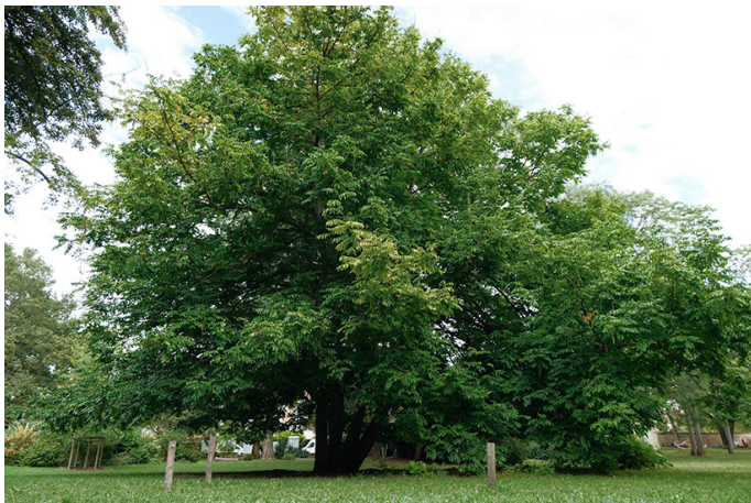
Ptérocaryer du Caucase.